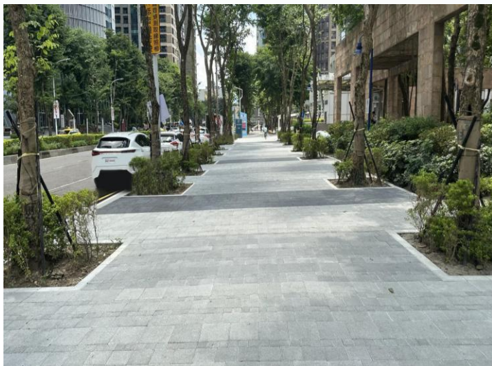
新站路高壓磚完成