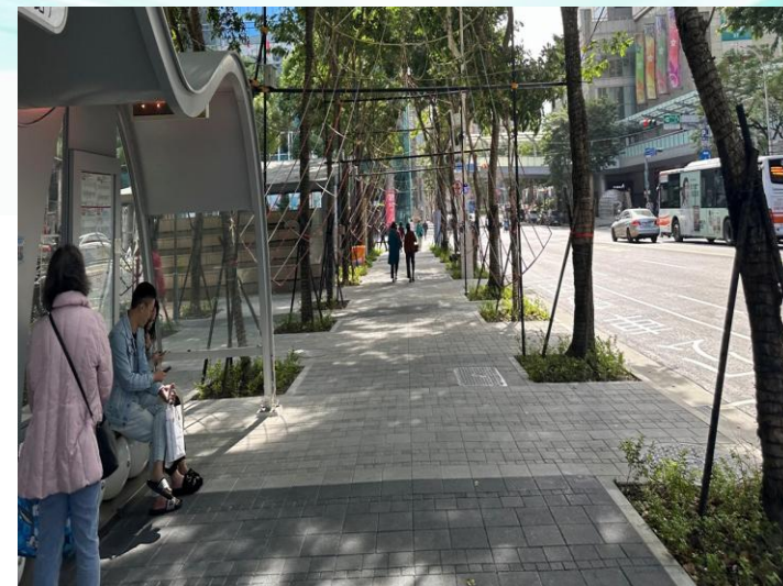
新府路高壓磚完成