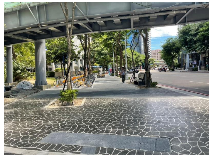
噴花地坪施作完成