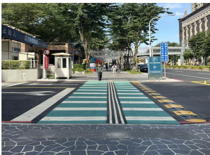
停車場出入口改善完成