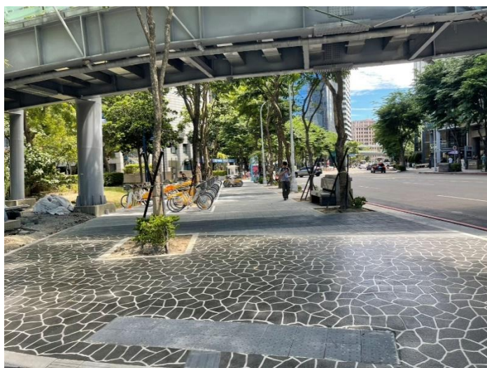
新府路第一階段完成