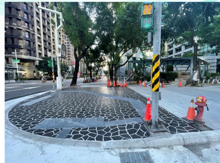
中山路第一階段完成