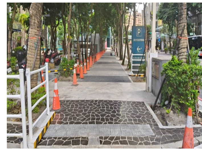
新府路第二階段完成