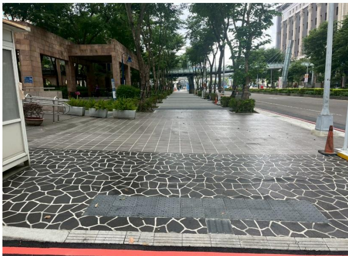
新站路第一階段完成