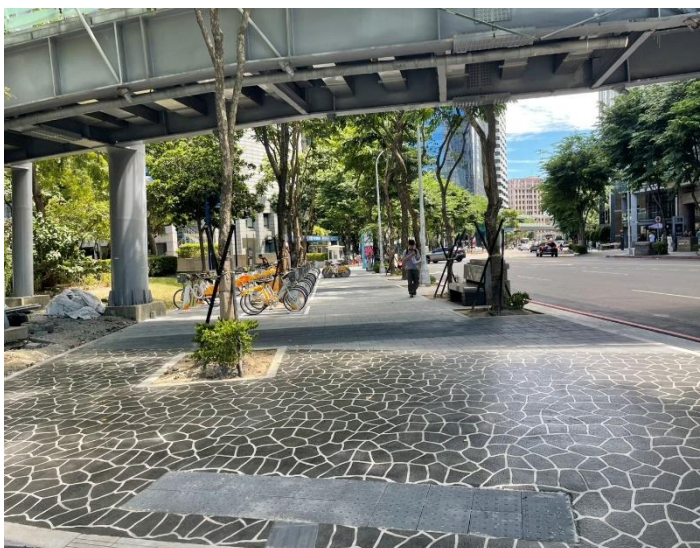
新府路第一階段噴花地坪