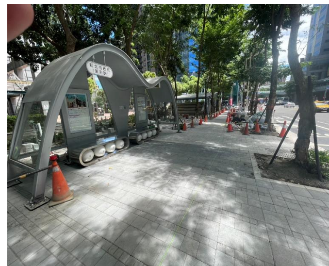
新府路第二階段收尾