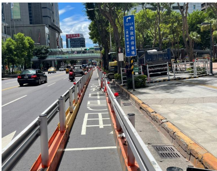
中山路第二階段交維設置