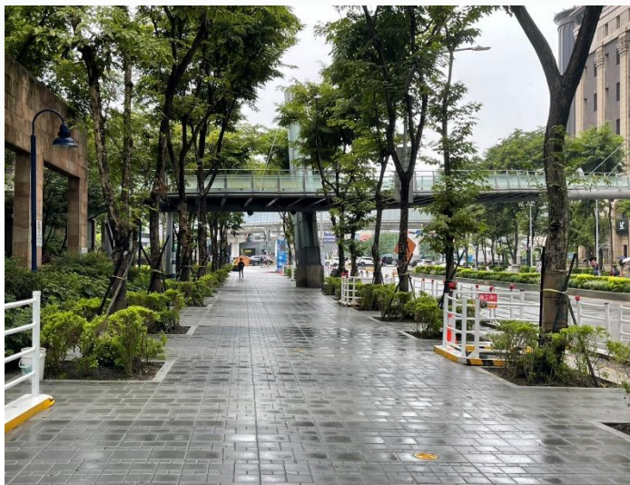
新站路第一階段收尾