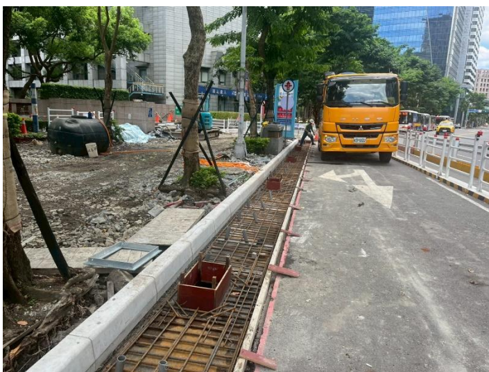
新府路第一階段溝蓋混凝土澆置