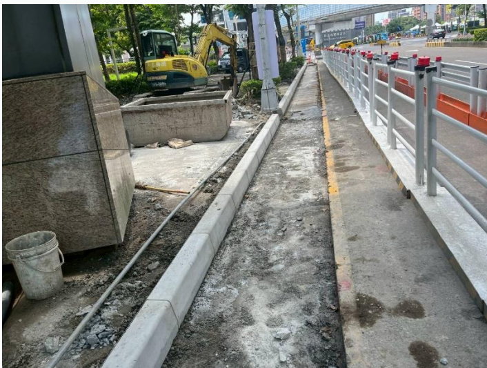
新站路第一階段路緣石施作