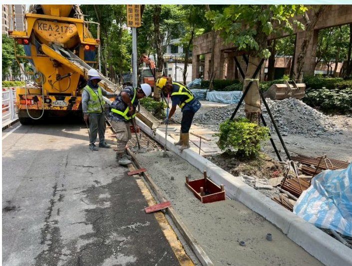
新站路第一階段溝蓋混凝土澆置