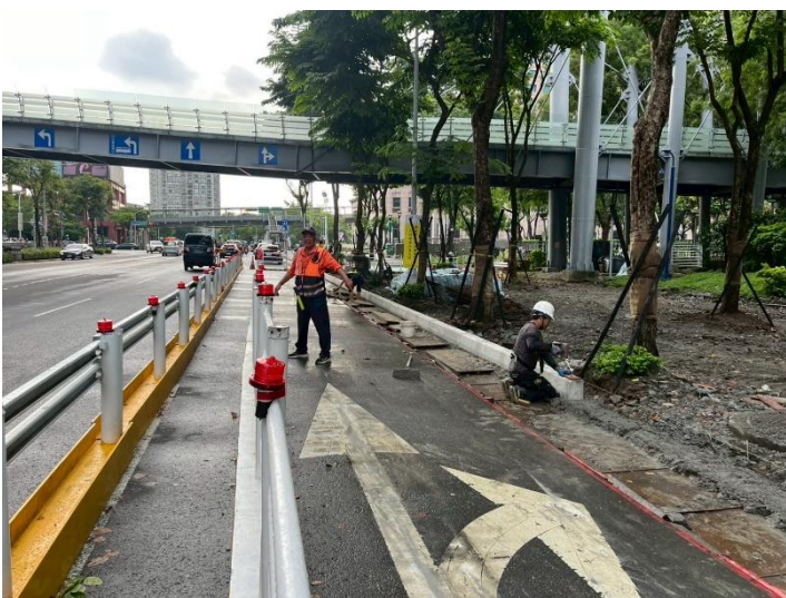
新府路第一階段路緣石施作