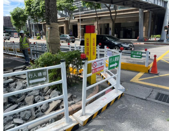
新府路第一階段交維設置