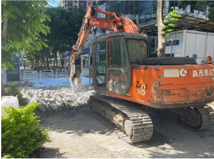
新站路第一階段打除