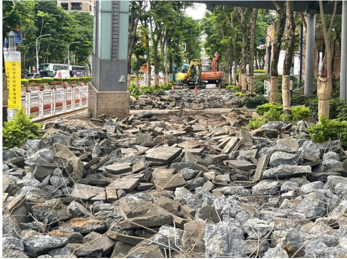
新站路第一階段打除