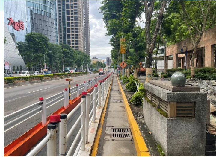
新站路第一階段交維設置