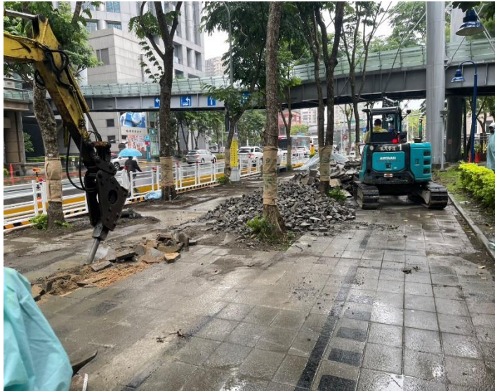
新府路第一階段打除