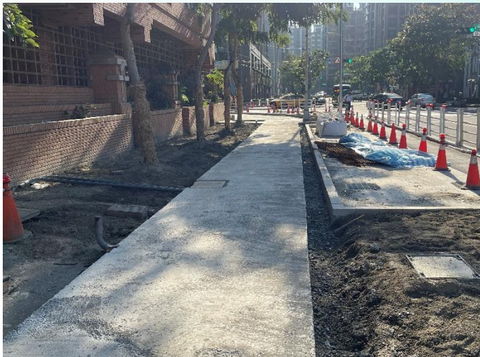
人行道工程-植栽帶修邊