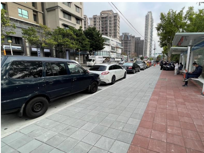
B區後半段人行道開放通行