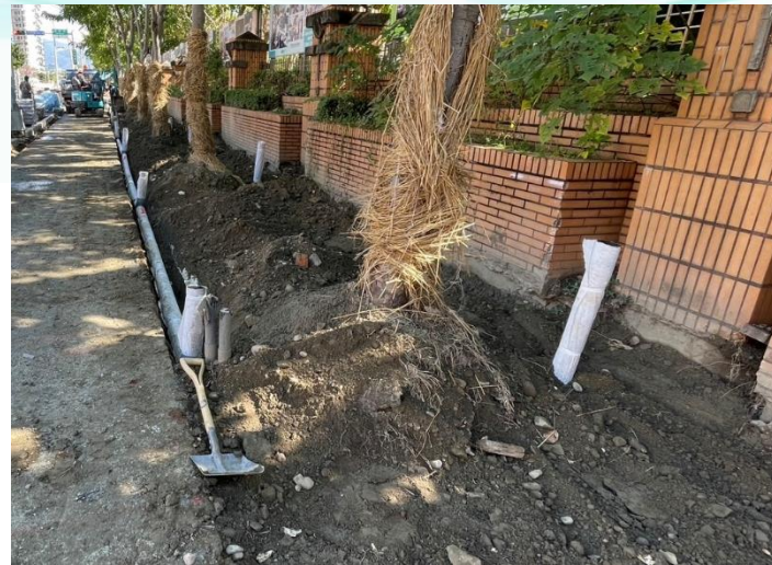
植栽工程-樹穴結構模組