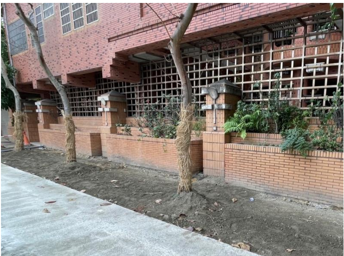
植栽工程-喬木施工保護