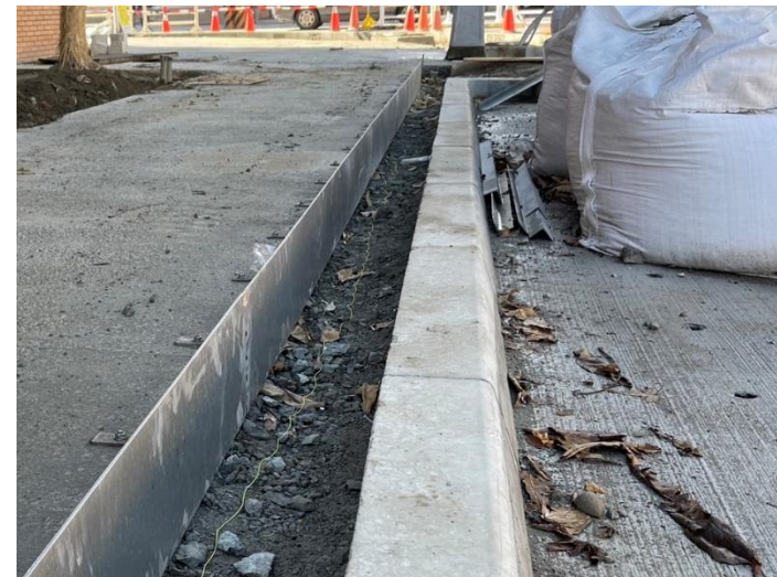
植栽工程-綠帶鋼板收邊