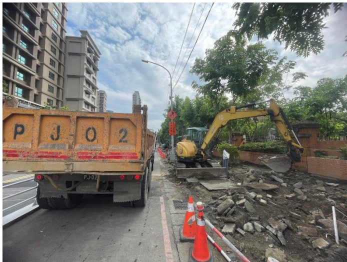
既有人行道磚面開挖