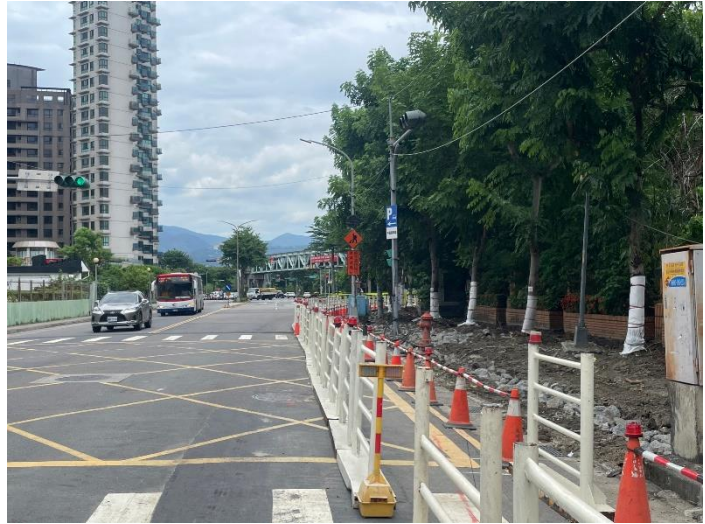
施工範圍預留人行通道