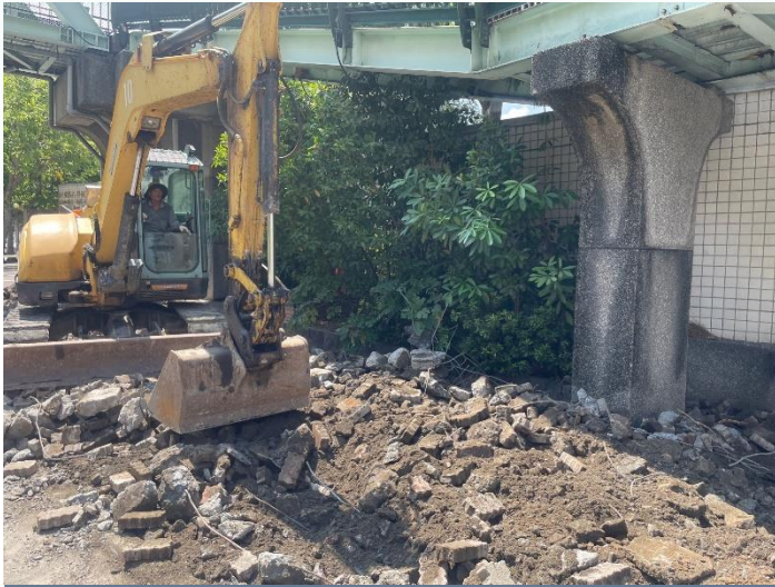
既有人行道磚面開挖