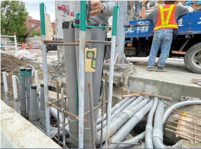
照明工程-照明基座施作