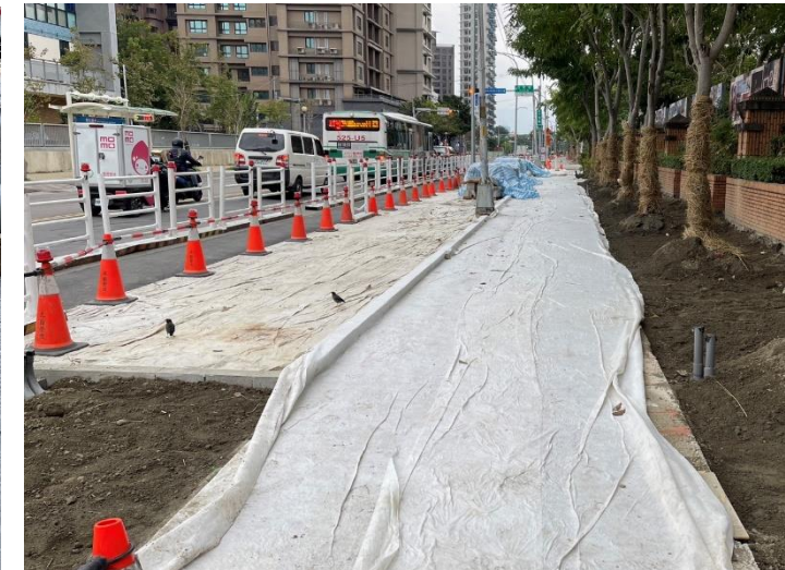
混凝土工程-澆置養護