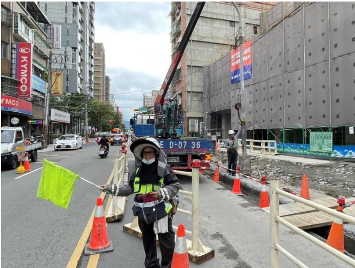
照明工程-路燈遷移