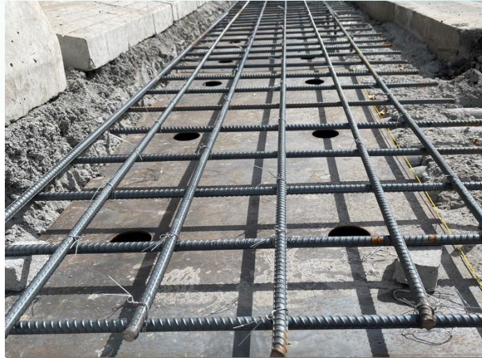
排水工程-鋼筋綁紮