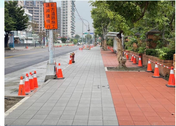
人行道工程-整磚對縫