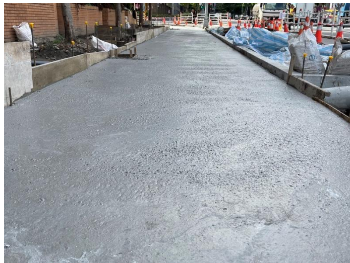
人行道工程-混凝土灌漿