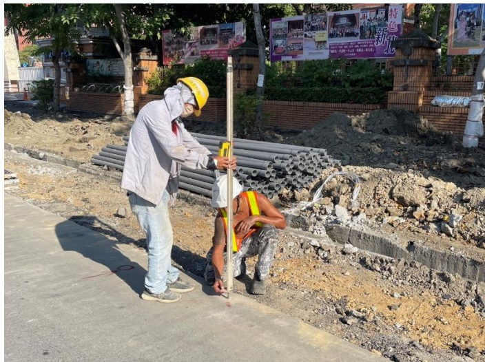
排水工程-高程放樣