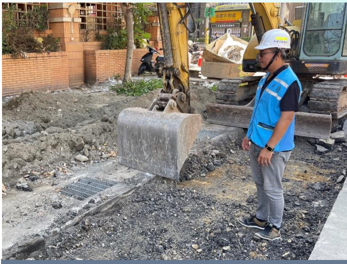
管溝工程-技師督導