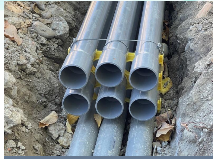
管溝工程-管架施作