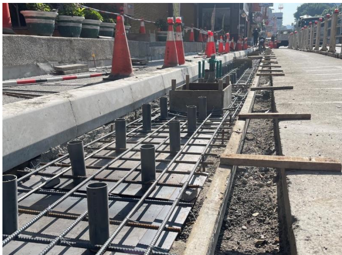
排水工程-模板組立