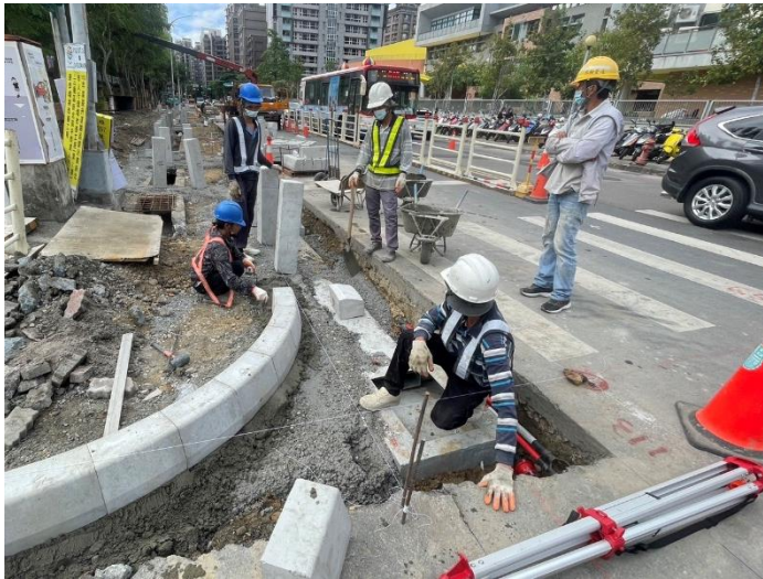
人行道工程-路緣石施作