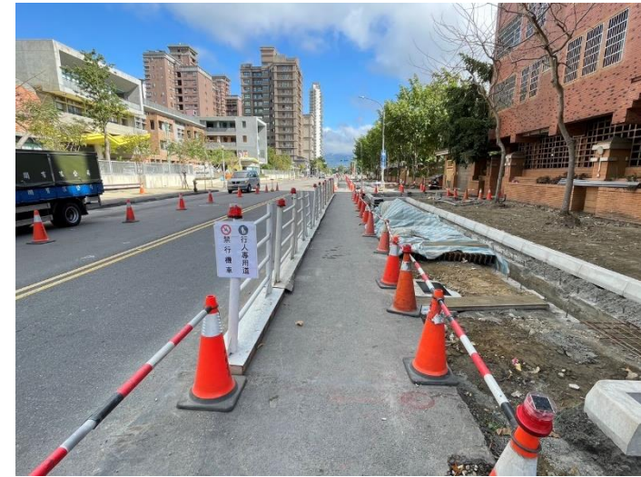
交維-槽鋼護欄、引導告示