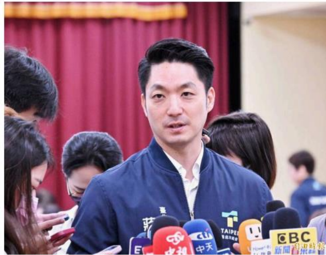
台北市長蔣萬安出席113年度市長與里長有約。